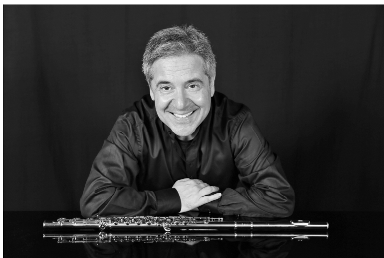
Docente di Flauto presso il Conservatorio di Musica “L. Marenzio” di Brescia